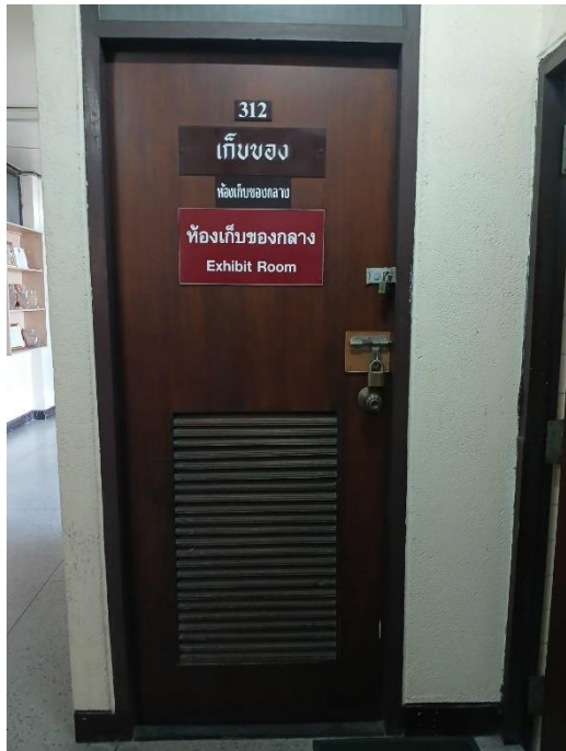
นำของกลางเก็บไว้ที่ห้องเก็บของกลาง