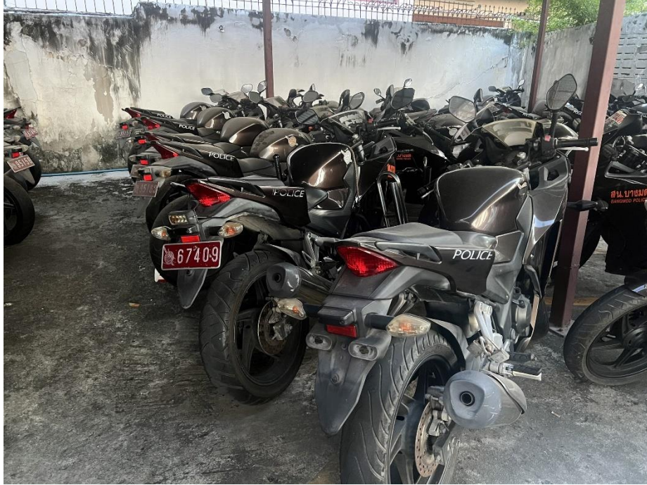
ภาพแสดงผลการดำเนินการ